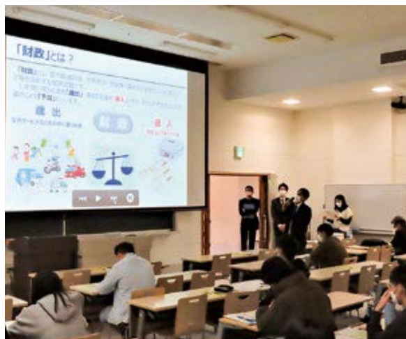
▲財務部職員による説明の様子

財務部では、地域の皆さまへ、財務省や金融庁の施策をお伝えするため、出前講座を実施しています。今号では、1月24日に沖縄大学（2・3年生90名）で行った金融・財政授業についてご紹介します。 授業では、最初に、「成年年齢引下げにかかる金融リテラシー」をテーマに、契約における注意点、クレジットカードの仕組みと返済方法、利用上のメリットや留意点、多重債務に陥らないための注意点等について説明しました。また、金融等トラブルに巻き込まれないための基礎知識として、SNSを通じた消費者トラブルや携帯電話買取詐欺など具体的な事例を紹介するとともに、投資に関するトラブルとして、顔見知り等から「必ず儲かる」「絶対に大丈夫」と勧誘をされても、投資の世界において「必ず