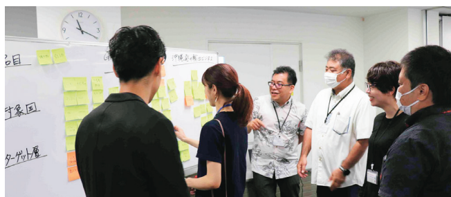
スタートアップ戦略会議