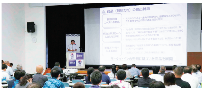
キックオフセミナー

輸出に取り組む第一歩として、また、新たなビジネスパートナーとの繋がりを構築する機会として、GFPへ登録してみたいかがでしうか。