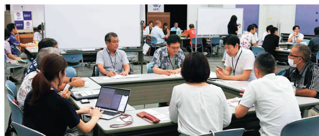
グループマッチング