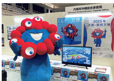
ブースの様子(ミyakミyak)

博では、「未来社会の実験場」をコンセプトに、空飛ぶクルマをはじめ、世界中から最先端の技術が集まります。産業まつりでは、公式キャラクターのミyakミyakも登場し、万博開催イメージを含む概要を紹介しました。参加者からは、「55年前の万博がすごく印象に残っているから今回も参加する。」「車が空を飛ぶ時代になった。時代についていけないけど、子どもたちと参加したい。」との声がありました。皆さんも、ぜひ未来社会を体験しに万博に参加してみてください。