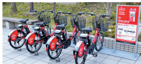
シェアサイクル (福岡合同庁舎)

財務省並びに関係省庁は、国の行政財産(庁舎や宿舍など)を活用し、地域貢献や脱炭素社会の実現など多様な政策課題等に対応するべく、取組を進めています。 庁舎の空きスペースや宿舍駐車場の一画などを、地方公共団体や民間の事業者様に様々な用途でご利用いただくことが可能(有償)となっております。