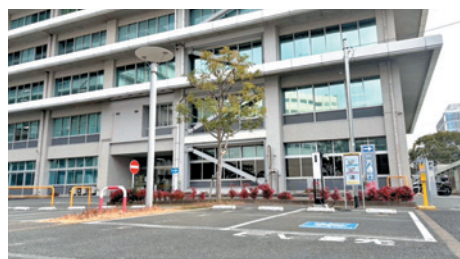
EV 用充電器 (福岡合同庁舎)

沖縄総合事務局管内の有効活用を検討している庁舎の空きスペースの情報については、沖縄総合事務局のホームページ(下記の二次元バーコード)をご覧頂るか、左記までお気軽にお問い合わせ下さい。