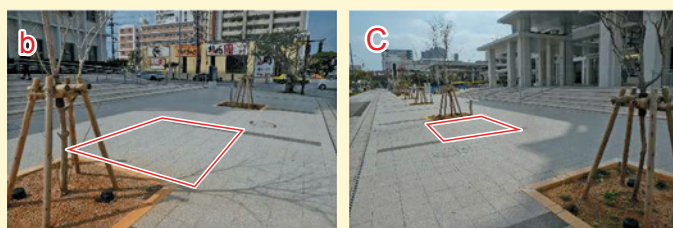
那覇第2地方合同庁舎の空きスペース (一例)