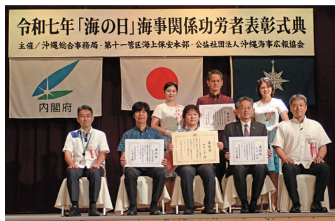
受賞者とC to Sea プロジェクトご当地アンバサダー

受賞された10名の中学生のみなさん、おめでとうございます。 表彰式には、C to Seaプロジェクトご当地アンバサダー沖縄の皆さんと、マスコットキャラクターのココちゃん＆ミライくんも式典に華を添えてくれました。