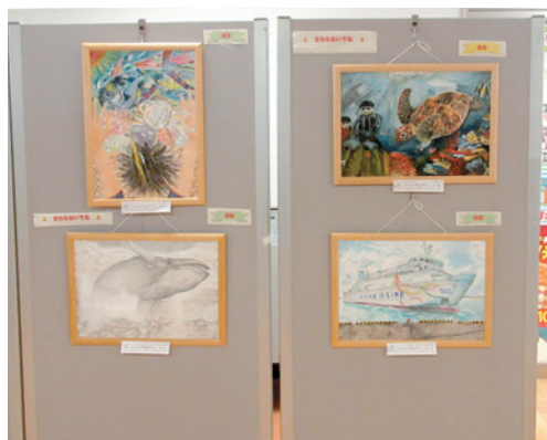
金賞・銀賞（3名）作品