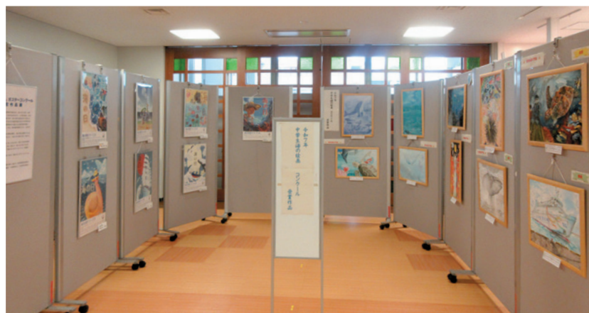
沖縄県中学生海の絵画コンクール受賞作品 展示