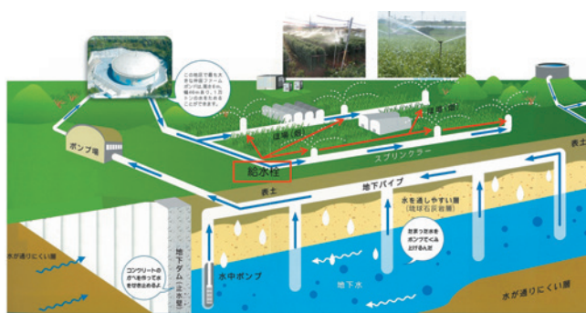
地下ダムから畑への水の流れ

ツアーにご参加いただいた皆様、ご協力いただいた皆様ありがとうございます。今後とも、地下ダムの見学ツアーを含め、当部が実施する事業等への理解を深めていくための活動を推進していきます。