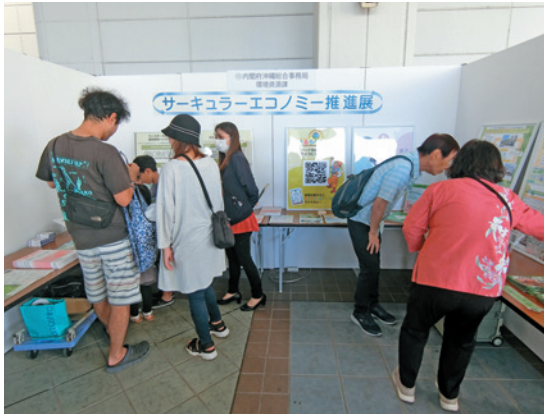
おきなわアジェンダ21県民環境フェア in なは

サーキュラーエコノミー（CE）は、日本語で循環経済と呼ばれ、これまでの大量生産、大量消費、大量廃棄の線形経済から脱却して、生産段階、利用段階、回収段階といったあらゆる段階で、廃棄物を出さず、資源の効率的・循環的な利用を目指す取組です。 CEの推進には、製造業者などの動脈産業と回収・リサイクルを担う静脈産業の連携や消費者の意識向上などが重要であり、県内におけるCEの普及啓発のためのイベントを実施いたしました。