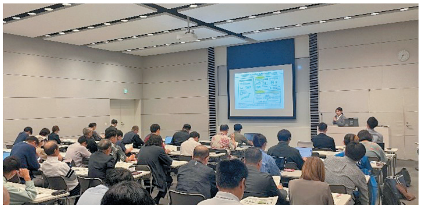
サーキュラーエコノミー普及・啓発セミナー

本セミナーでは、経済産業省や環境省九州地方環境事務所による取組事例や、福岡市によるプラスチック資源の分別収集導入に向けた取組、県内企業によるCEの取組をご講演いただきました。 当局では、今後も関係機関と連携し、CEの推進に取り組んでまいります。