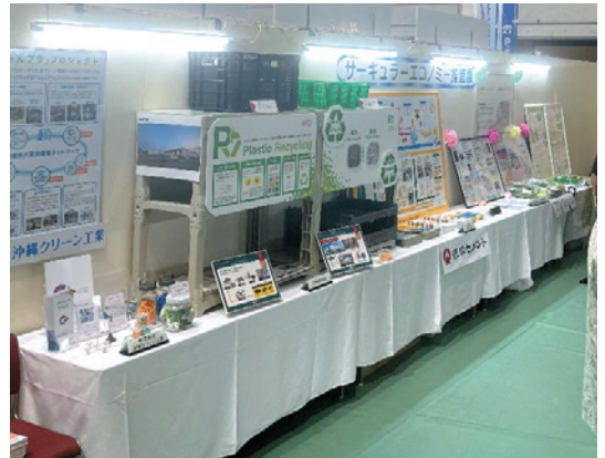
第49回沖縄の産業まつり

11月18日には、動脈側である製造業者や静脈側を担う市町村担当者などを対象にCEの意識向上や連携促進を目的として、「沖縄管内におけるサーキュラーエコノミー普及・啓発セミナー」を開催しました。