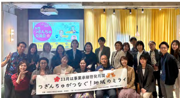
「女性つぎんちゆ交流会」の様子 (右から4番目の前方が私です！)

事業者や関係機関とやりとりする機会も多く、日々新しい学びが得られます。企業の成長や経営課題への取組を後押しし、沖縄の経済を支える仕事に関われるのが魅力です♪