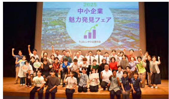
「中小企業魅力発見フェア」の様子