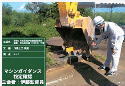
有限会社 南成土木 情報化施工の様子