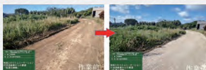
大里建設 地域貢献の農道整備