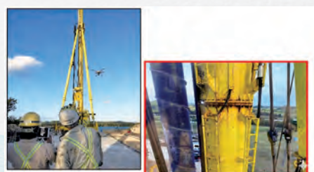
前田・共和 JV 施工機械の点検の様子