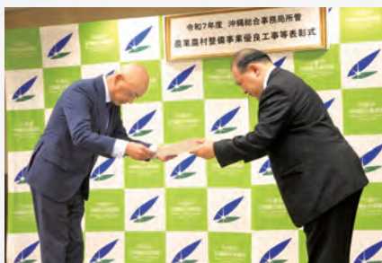
表彰状 手交の様子