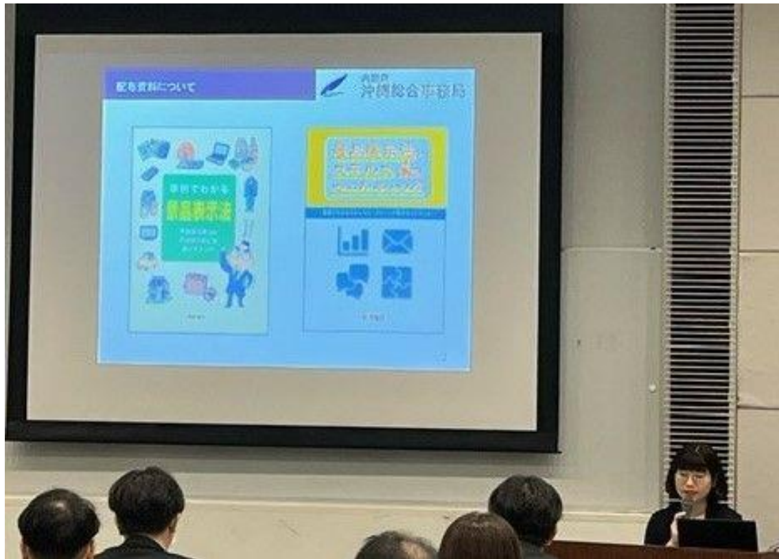
那覇市における講習会の様子

令和5年度は、沖縄県中頭郡読谷村（令和5年7月）及び那覇市（令和6年2月）において、事業者向けの講習会（景品表示法説明会）を開催した。また、事業者団体が開催する講習会や大学の講義に計7回（事業者団体：1回、大学：6回）講師を派遣した。