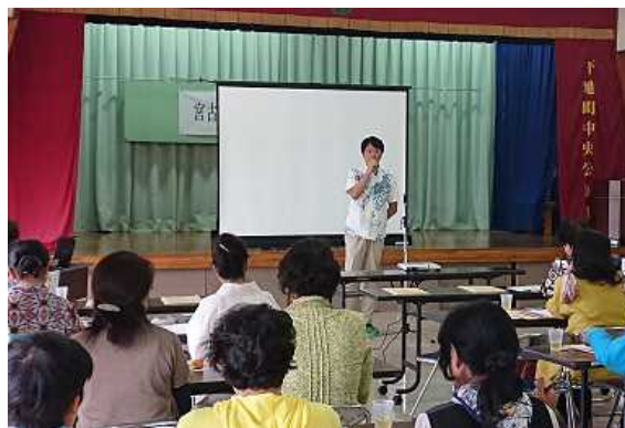
宮古島市におけるセミナーの様子