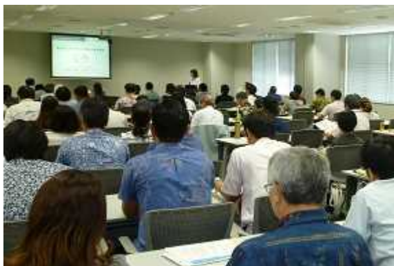
那覇市における説明会の様子