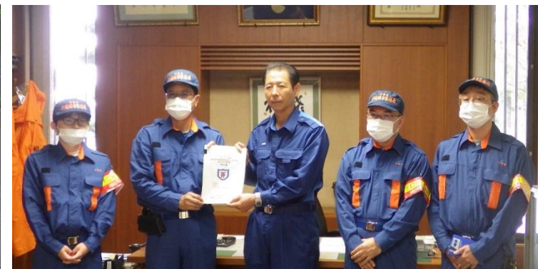
村長への調査結果報告（相良村）