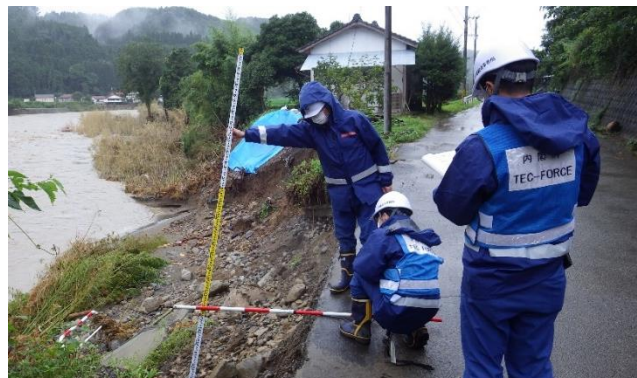
損壊した道路の調査状況（相良村）