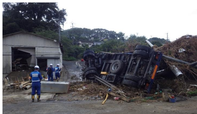
漂流物による道路封鎖状況（八代市）