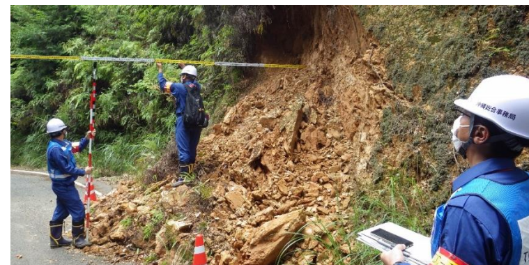
崩落した斜面の調査状況（八代市）