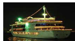
旅客不定期航路事業者 (遊覧船等)