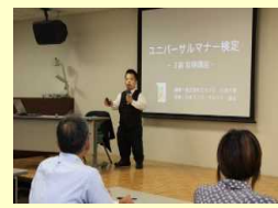
当事者講師によるセミナー