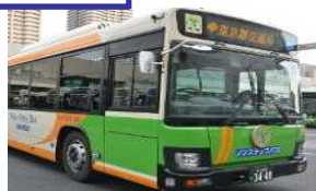
路線バス事業者(定期運行)