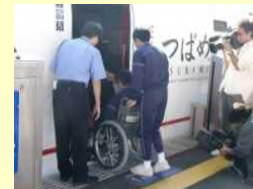
車椅子サポート体験