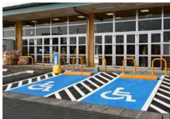
(車椅子使用者用駐車施設)