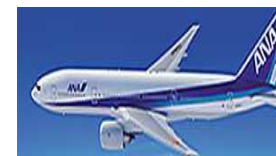
本邦航空運送事業者