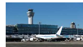
航空旅客ターミナル管理者