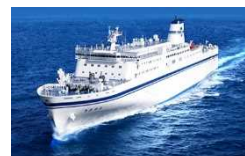
一般旅客定期航路事業者