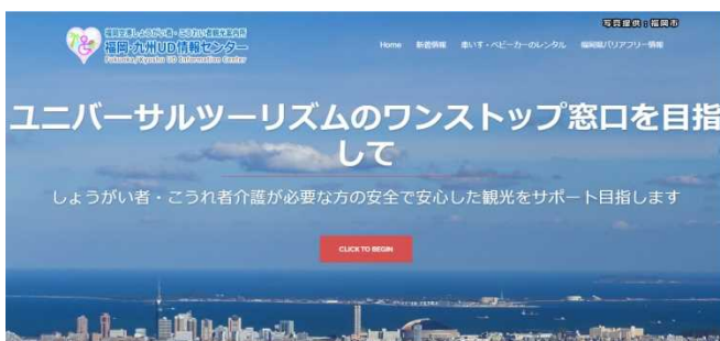
〈福岡・九州UD情報センターHP〉

また、福岡・九州UD情報センターHPが開設しました。福岡県のバリアフリー情報はもちろん、車いすのレンタル予約やお問い合わせフォーム、新着情報を更新しています。日本語・英語・韓国語・中国語など多言語に対応しています。