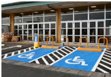
(車椅子使用者用 駐車施設等)