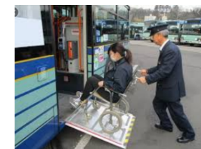
路線バスにおける役務提供(スロープ設置・介助)の例