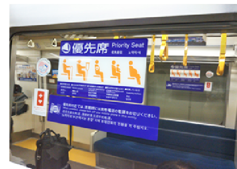
(旅客施設・車両等の 優先席)