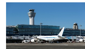
航空旅客ターミナル管理者