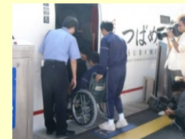
車椅子サポート体験