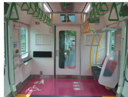
(車両等の車椅子スペース)