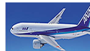
本邦航空運送事業者