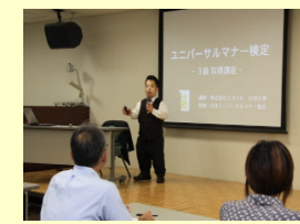
当事者講師によるセミナー