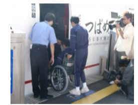
車椅子サポート体験