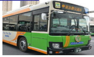
路線バス事業者(定期運行)