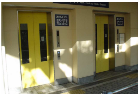
(旅客施設の エレベーター)