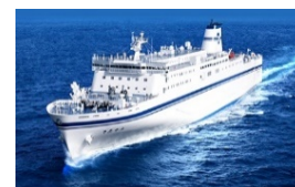
一般旅客定期航路事業者