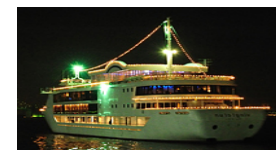
旅客不定期航路事業者 (遊覧船等)