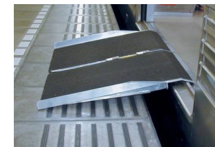
駅ホームにおけるスロープ板設置の例