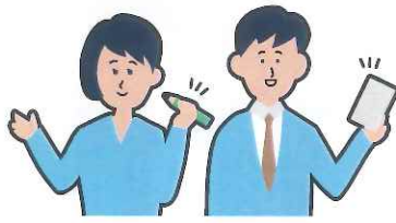
だいひつがかり かくにんがかり ▲代筆係 ▲確認係

だいりとうひょう おこな ばあい うけつけ ほんにん 代理投票を行いたい場合は、受付でご本人が