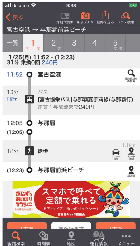
「乗換案内」アプリでのバナー（下部分）