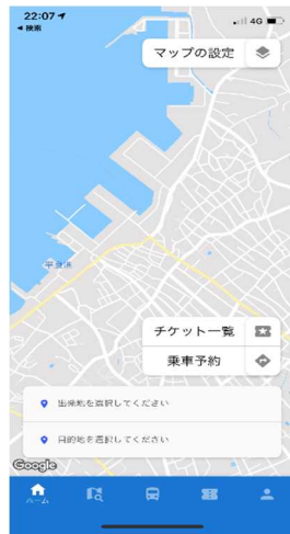
▲乗車場所と降車場所の指定