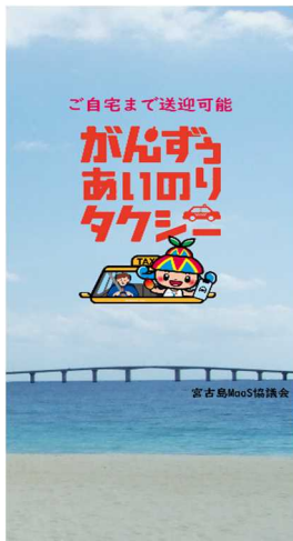
▲アプリトップ画面