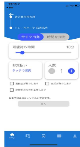
▲乗車時間・チケットなどを選択