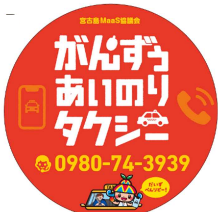
車両用ステッカー