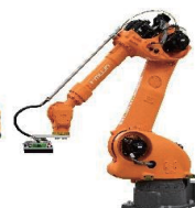
ピッキングロボット