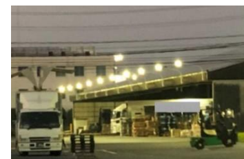
トラックターミナル