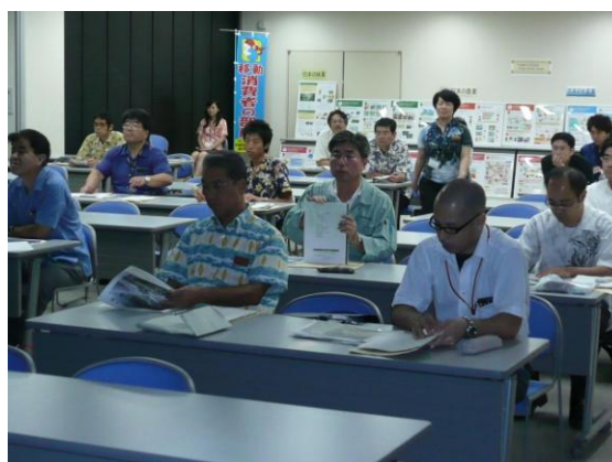
説明会場と展示パネル（写真後方）