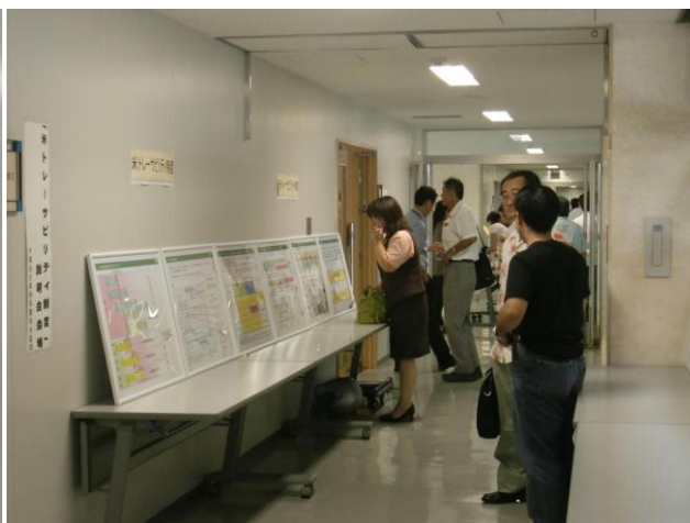
説明会場に併設した展示パネル