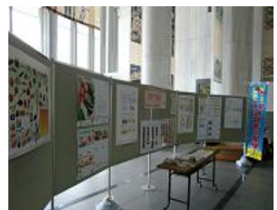
沖縄県庁ロビー （6月13日～17日）