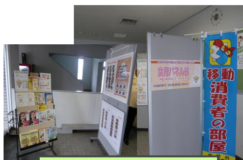
名護地方合同庁舎 （6月28日～30日）