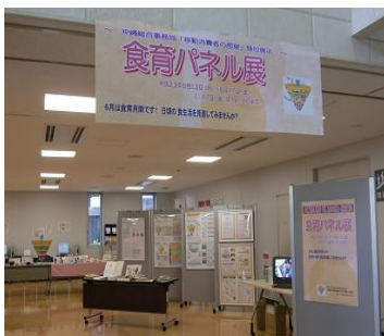
那覇地方合同庁舎 （6月13日～17日）