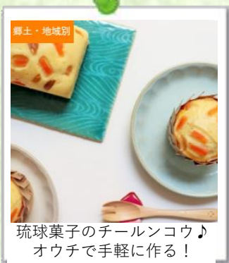
琉球菓子のチールンコウ♪ オウチで手軽に作る！