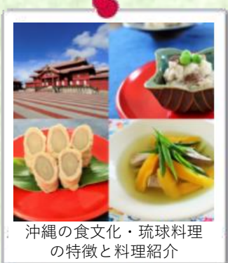
沖縄の食文化・琉球料理の特徴と料理紹介

沖縄食材を使った料理をはじめ琉球料理・各地の郷土料理、こどもが作れるレシピ、食材を上手く活用するサステイナブルレシピなど、食の課題解決に貢献するレシピを数多く掲載しています。