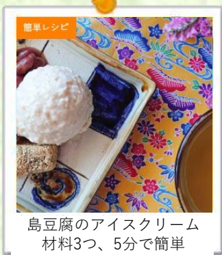
島豆腐のアイスクリーム 材料3つ、5分で簡単