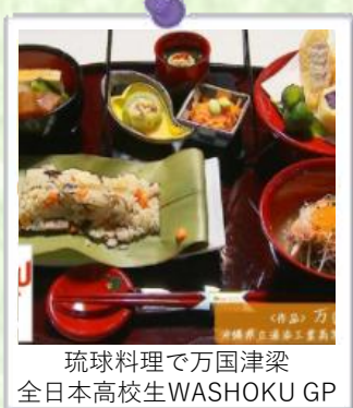
琉球料理で万国津梁 全日本高校生WASHOKU GP