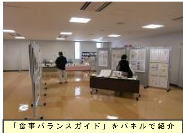
「食事バランスガイド」をパネルで紹介