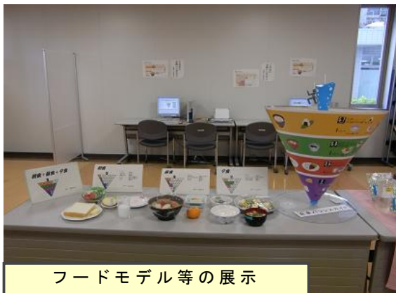
フードモデル等の展示