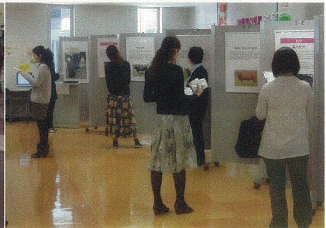
クイズにも答えていただきました