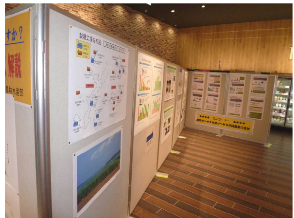
マックスバリュ豊見城店内展示場