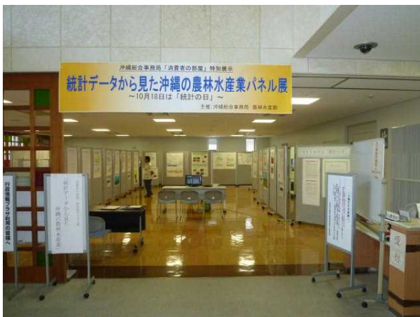
行政情報プラザ展示場

内 容：10月18日の「統計の日」にちなみ、沖縄の農林水産業について広く理解を深めてもらうことを目的に、農林水産統計調査の結果をわかりやすくグラフにしたパネル展示を、前回開催の行政情報プラザに加えて新たにマックスバリュ豊見城店内でも開催しました。パネル展示は、グラフ、ハンドブック等の設置及び農林水産統計に関するビデオの上映や、農業経営統計調査等に永年御協力いただいている方に対し、農林水産大臣から感謝状が授与されたことも紹介しました。