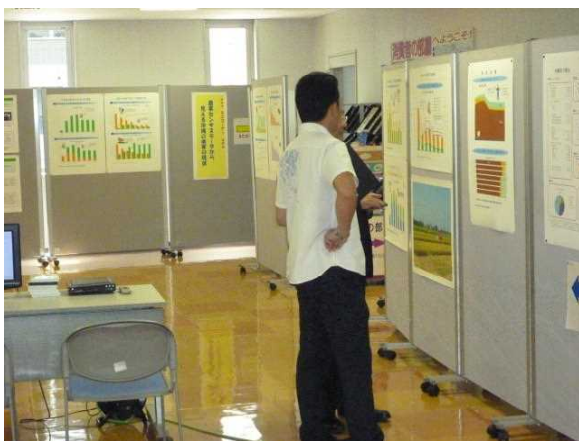
見学者（行政情報プラザ）