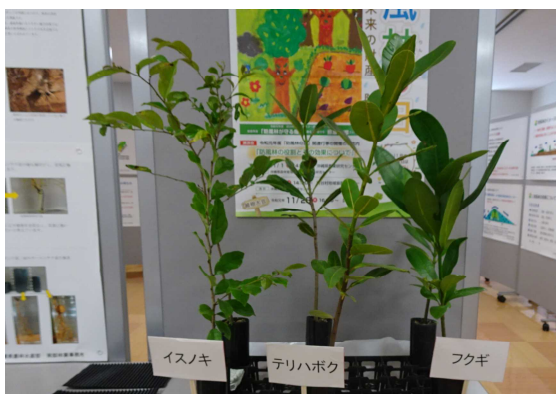
Mスターコンテナ苗の展示