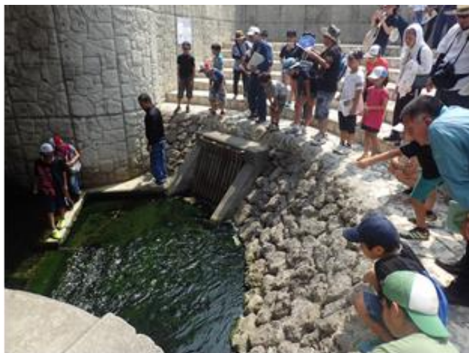
慶座地下ダム見学の様子