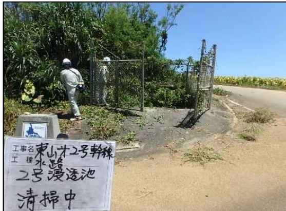
清掃活動状況(草刈り)