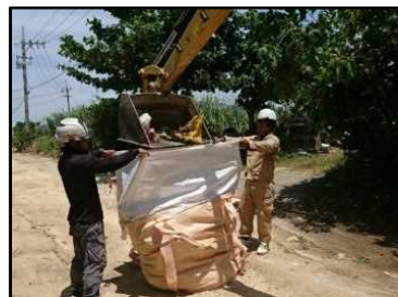
不法投棄物集積状況