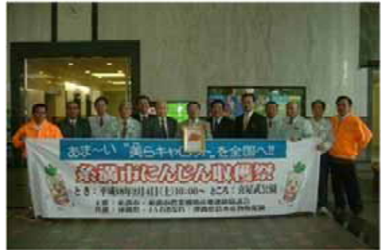
写真2 ニンジン専門委員会等

昭和58年に整備された農業用水施設の利用組合であり、集落のほとんどの家が加入している。土地改良の未整備地区においては、現在でもなお重要な給水源となっている。