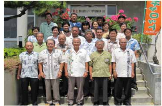
写真 1 受賞者

昭和55年頃から、喜屋武生活改善グループが中心となり、農産物の加工品づくりを行うなど、女性たちが農産物の付加価値向上に積極的に取り組んでいる。