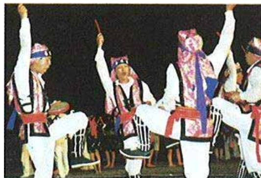
写真6 喜屋武エイサー