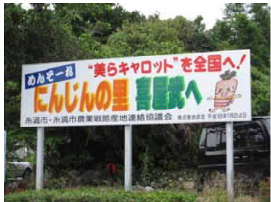
写真4 ニンジンをアピールする看板

ニンジン専門委員会では、甘くて食味の良い「TE-30」に品種を統一するとともに、寒冷紗使用による発芽率向上など技術普及を徹底した。また、ＪＡ、行政組織等の連携による支援チームを立ち上げ、ニンジン栽培の省力化に取り組んでいる。間引き作業の省力化を図るため、シーダーテープの導入普及に努めた結果、シーダーテープ活用者は平成18年は11戸、平成20年には50戸となった。また、特Ａチームのニンジン生産にかかる労働時間、収益、コストの調査の結果、ニンジン再生産に必要な経営目標として、「農家手取り1,000円/10kg以上、反収4t/10a」と設定し、これを達成するため、技術実証展示ほの設置、栽培講習会等が実施されている。