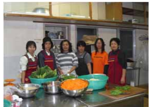
写真3 喜屋武集落の女性たち

また、昭和50年代以降、農産物の加工による付加価値向上に貢献したのも、生活改善グループを中心とした女性たちであった。