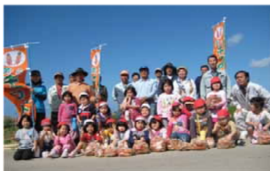
写真7 喜屋武集落の人々

戦後の村屋(ムラヤー)に代わり昭和46年から使用していた公民館が老朽化により平成10年に解体されたため、公民館の早期建設を望む声は多かった。国の助成事業を活用するとともに、区民の負担金・寄付金により、平成15年に近代的な機能と規模を備えた現在の公民館(喜屋武コミュニティセンター)が落成し、各種団体の情報交換会、学習会、憩いの場として有効に活用されている。