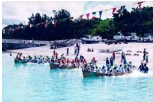
写真5 喜屋武ハーリー

また、平成16年に自治会内に字誌編纂委員会を設置し、喜屋武地域の風土、文化、行事、儀礼等について聞き取り調査を行い、現在編集作業を進めているところである。