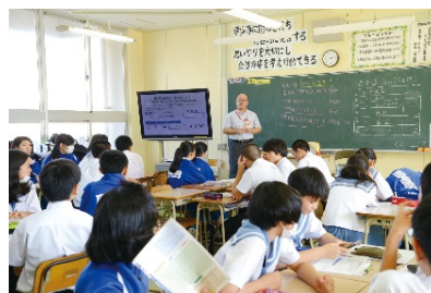
コープおきなわ スタッフによる 授業の様子

中学生を対象に、学校や行政、生産者、地元企業等様々な関係者と連携し、地域の農林水産物を活用した特産品開発を通じた総合学習を支援しています。地域が一体となった地産地消の取組をけん引するとともに、中学生が自ら地域の歴史や特徴、産業の課題や農林水産物の特性を発見し、特産品販売を通じて地域の魅力を発信することで、地域の「誇りづくり」の醸成につなげています。