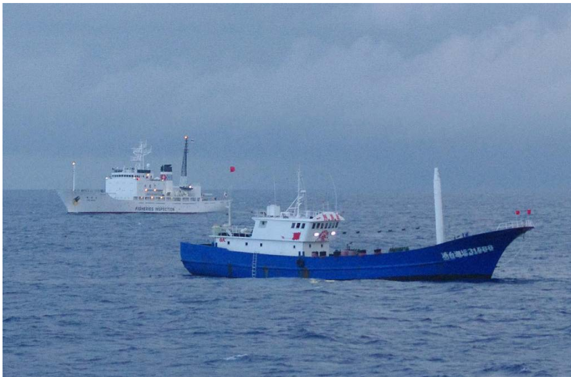
浙台漁運31488(手前)と、水産庁漁業取締船東光丸(奥)